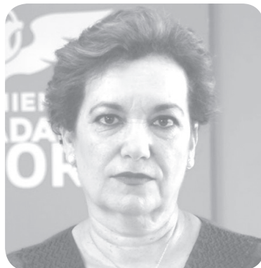
María Dolores del Río Sánchez