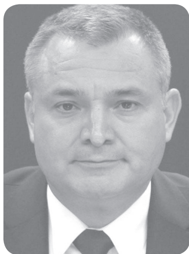
Genaro García Luna