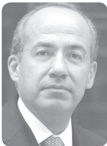
Felipe Calderón Hinojosa