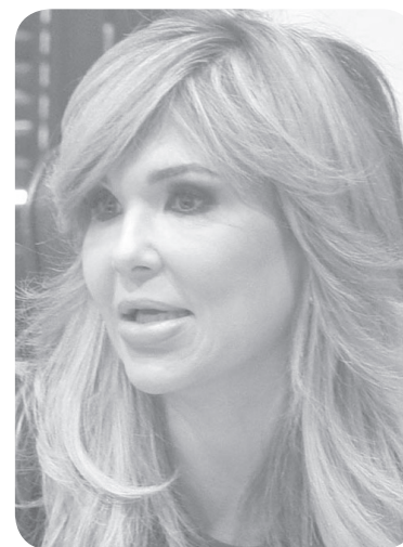
Claudia Pavlovich Arellano

Tal como los icebergs muestran sobre la superficie del agua solo una pequeña parte de su real dimensión, así es como la corrupción en México siempre ha evidenciado solo una fracción de su enorme voluminosidad.